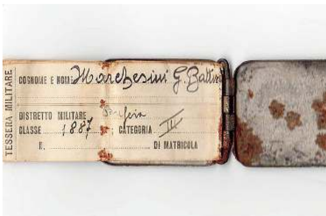
Documento. La tessera militare dell'uomo di Rezzato